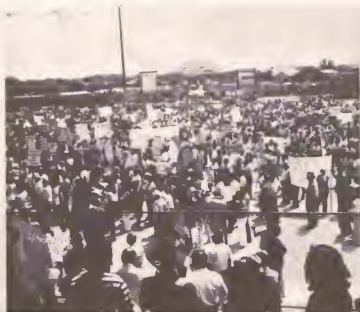
Promer manifestacion organisa pa M.E.P. na aña 1973, den Wilhelmina Stadion, durante bishita di e parlamentarionan Hulandes.

nisa den un Wilhelmina Stadion completamente yen un manifestacion masal cu presencia di e parlamentarionan Hulandes y Antiyano. Pueblo den e ocasion aki a demostra di ta completamente tras di e ideal di M.E.P.